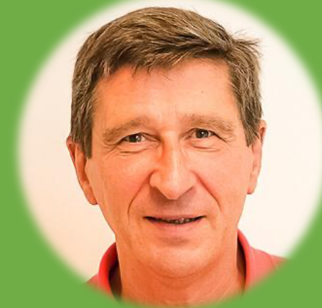
Délégué général UNICLIMA