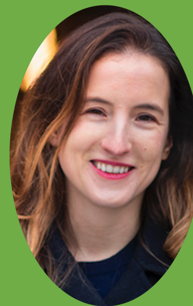
Directrice Fondatrice MINEKA