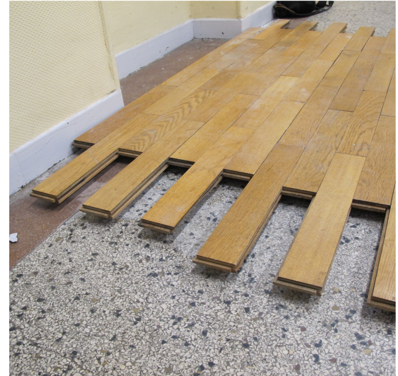
Anticipation de la préparation au réemploi Lot A, Autre-Soie, Villeurbanne