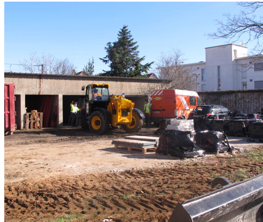
Stockage inter-chantier L'Autre-Soie Villeurbanne