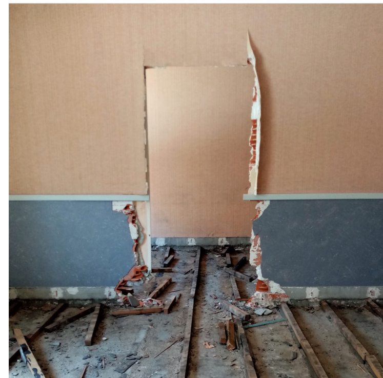
Suivi Déconstruction sélective CU Mendès France à Roanne