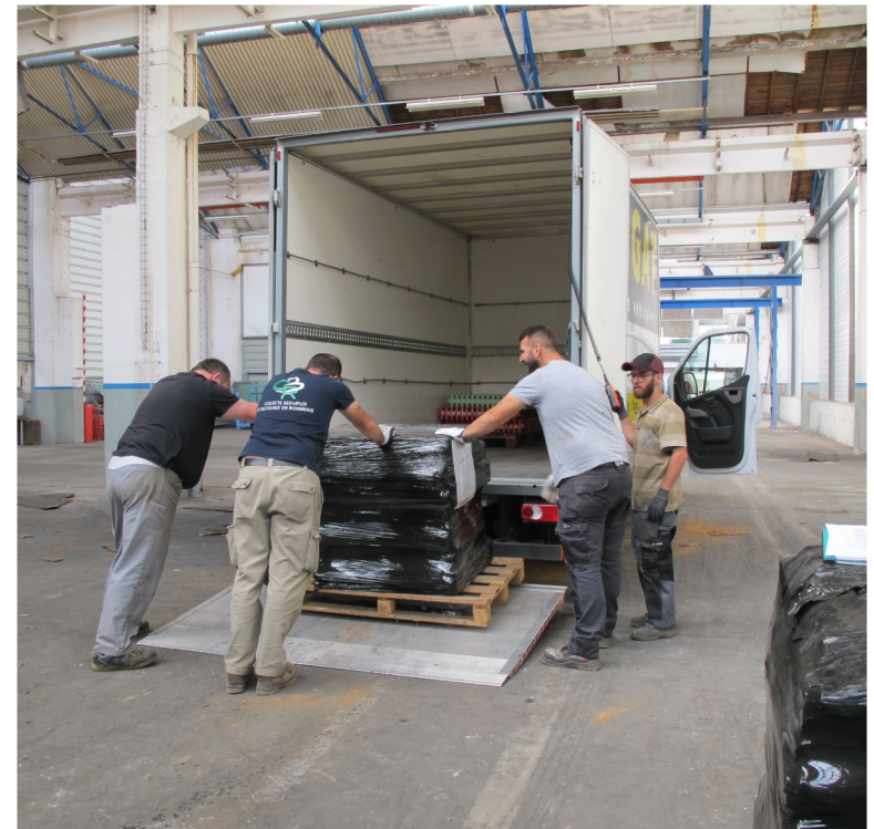
Collecte sur plateforme de stockage par C3R CU Mendès France à Roanne