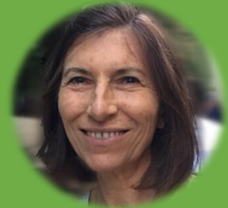
Juriste GROUPE SMABTP