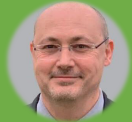
Directeur technique, Chef département Prévention, Risques et Expertises SOCABAT